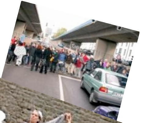
(Bilder oben: Rhythmuskarawane mit Blockade einer Straßenkreuzung und Tanz durch die Innenstadt von Halle/Saale beim Attac-Theaterfestival Sept. 2004)