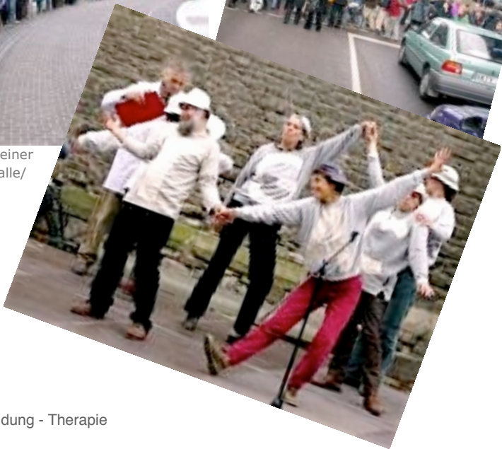
(Bild rechts: Kritik an der Gentechnik, Geneballet, das aus dem Ruder läuft)