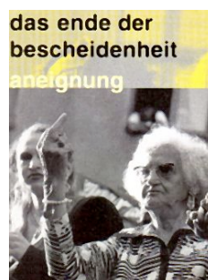
oder vielleicht dann so =>