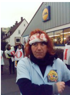
<= Bei einer Theateraktion gegen die Praktiken von Lidl, Kassel ( 2005)