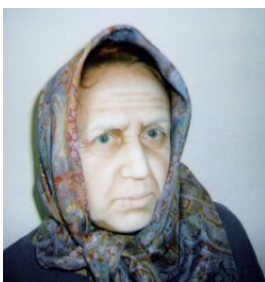
<= Mein Aussehen in 30 Jahren? na hoffentlich nicht! Rollenentwicklung für die Figur einer renitenten Alten im politischen Theater nach 20 Minuten Schminken durch Maskenbilderinnen des Staatstheaters Kassel (2005)