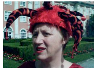
Als Narr skeptisch in Meersburg (2006) =>