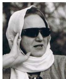
<= als Diva (2006)